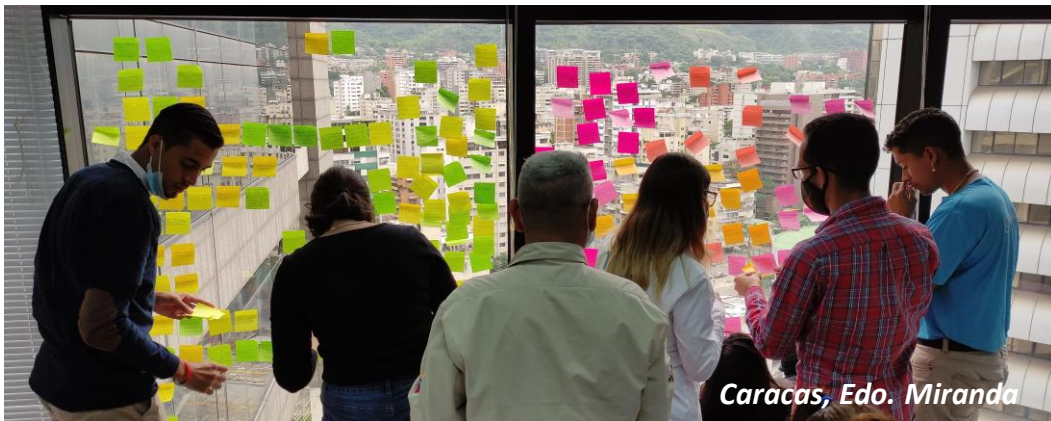
Caracas, Edo. Miranda

Si consideras que tu organización requiere alguno de estos servicios o algún otro relacionado con esta área técnica de trabajo, ¡contáctanos!