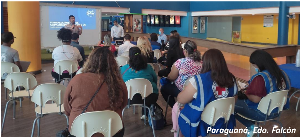
Paraguará, Edo. Falcón

Si consideras que tu organización requiere alguno de estos servicios o algún otro relacionado con esta área técnica de trabajo, ¡contáctanos!