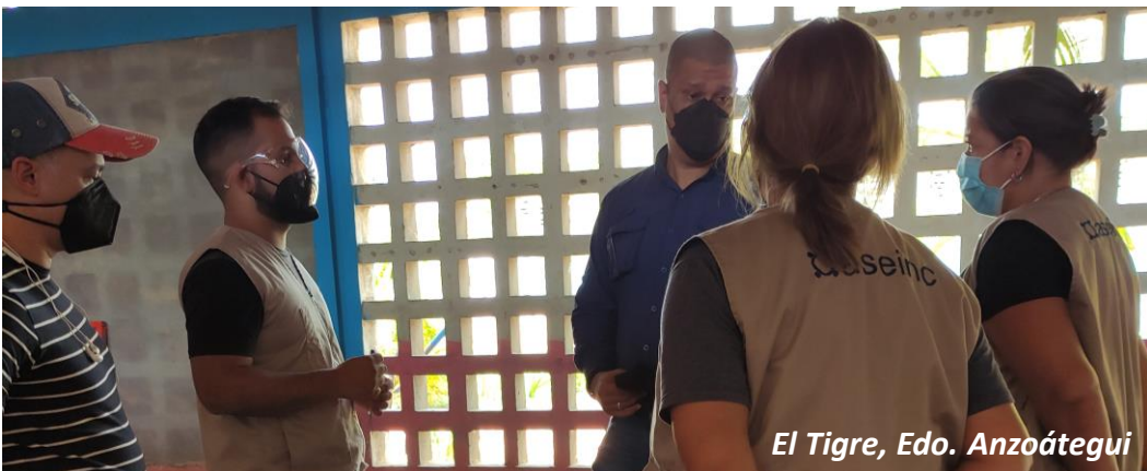
El Tigre, Edo. Anzoátegui

Si consideras que tu organización requiere alguno de estos servicios o algún otro relacionado con esta área técnica de trabajo, ¡contáctanos!