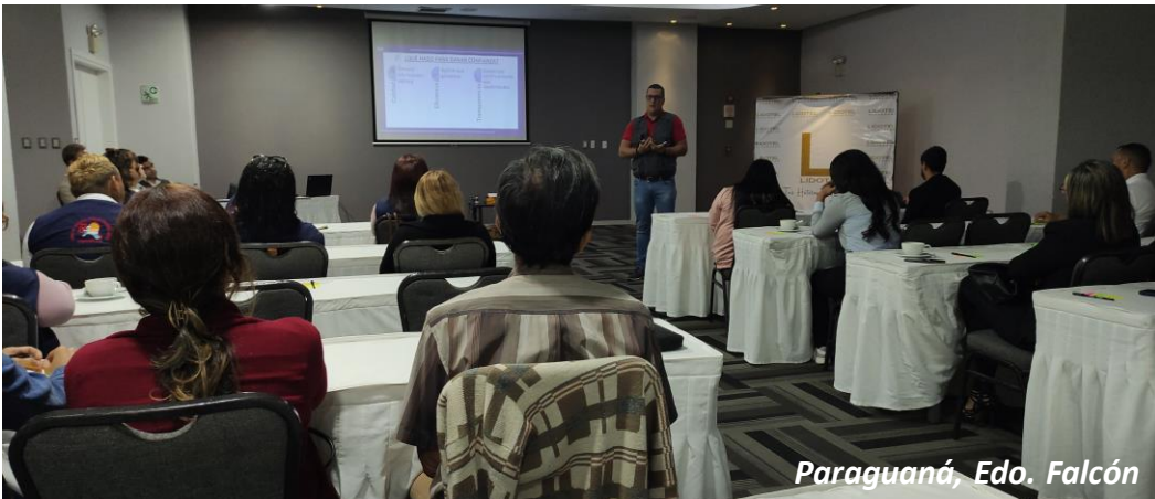
Paraguaná, Edo. Falcón

Si consideras que tu organización requiere alguno de estos servicios o algún otro relacionado con esta área técnica de trabajo, ¡contáctanos!