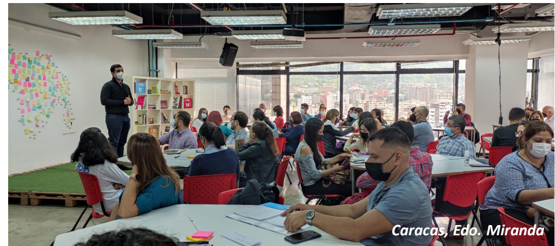
Caracas, Edo. Miranda