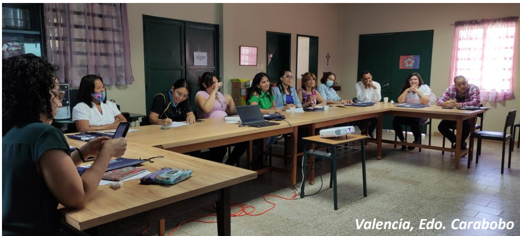
Valencia, Edo. Carabobo

Si consideras que tu organización requiere alguno de estos servicios o algún otro relacionado con esta área técnica de trabajo, ¡contáctanos!