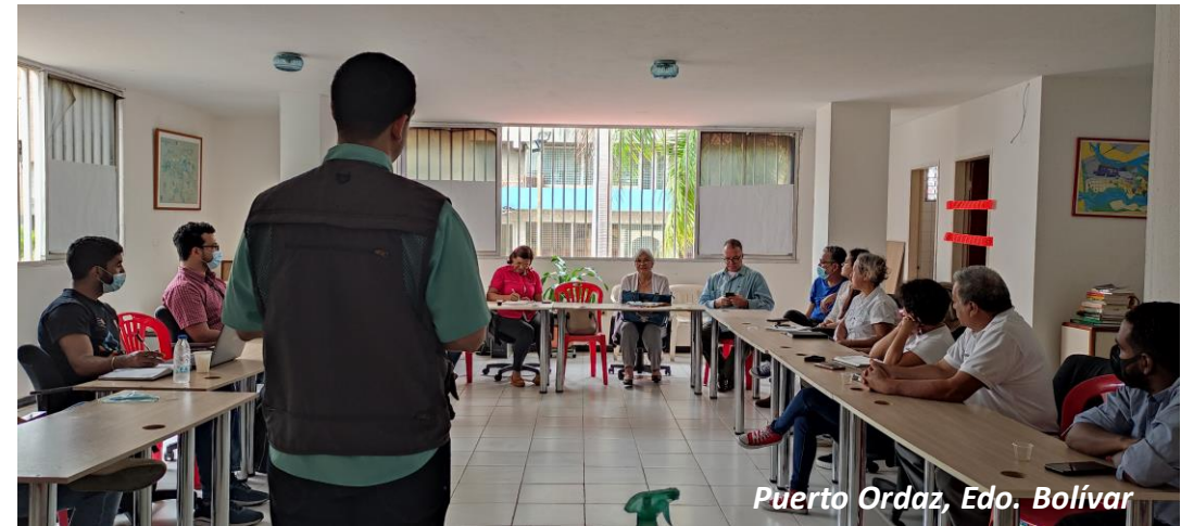
Puerto Ordaz, Edo. Bolívar

Desde el año 2020, hemos desarrollado alianzas que nos han permitido ampliar el alcance de nuestro trabajo, que hasta la fecha se extiende a todas las localidades de Venezuela, y nos ha permitido trabajar con más de 300 organizaciones nacionales y locales que ejecutan proyectos humanitarios y de desarrollo, y que han recibido de Fundación S4V , más de 7.800 horas de acompañamiento técnico y formación , que han logrado la especialización y capacitación de más de 1.600 personas .