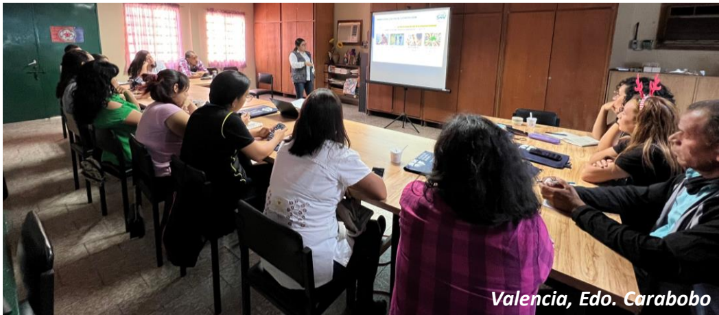
Valencia, Edo. Carabobo

Si consideras que tu organización requiere alguno de estos servicios o algún otro relacionado con esta área técnica de trabajo, ¡contáctanos!