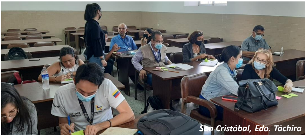
San Cristóbal, Edo. Táchira

Si consideras que tu organización requiere alguno de estos servicios o algún otro relacionado con esta área técnica de trabajo, ¡contáctanos!