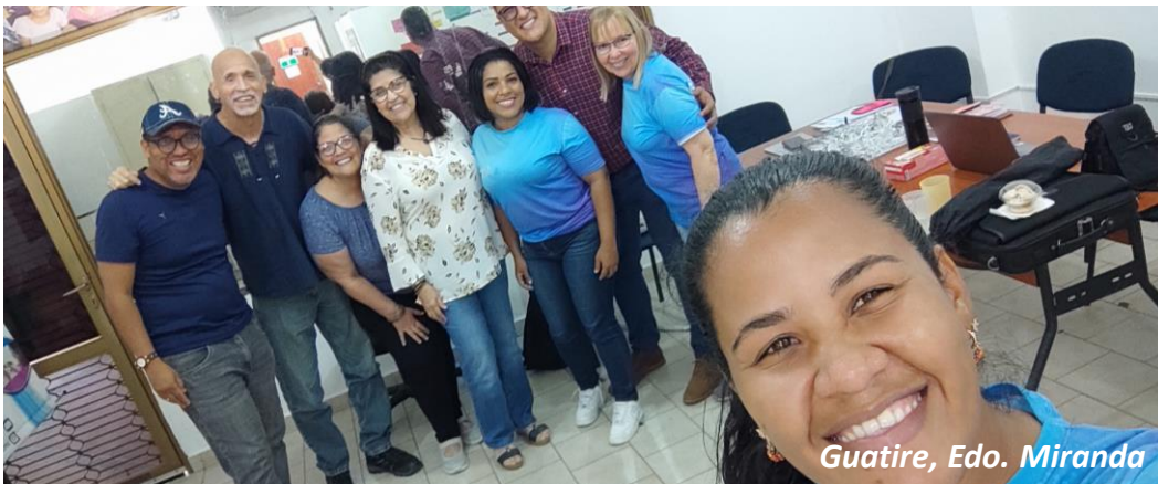
Guatire, Edo. Miranda

Si consideras que tu organización requiere alguno de estos servicios o algún otro relacionado con esta área técnica de trabajo, ¡contáctanos!