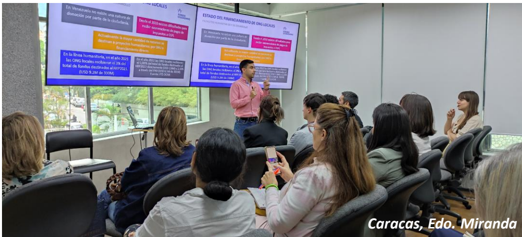
Caracas, Edo. Miranda

Si consideras que tu organización requiere alguno de estos servicios o algún otro relacionado con esta área técnica de trabajo, ¡contáctanos!